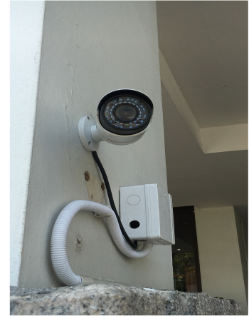
ภาพที่ 2-1 พนักงานรักษาความปลอดภัย และกล้องวงจรปิดประจำโครงการฯ