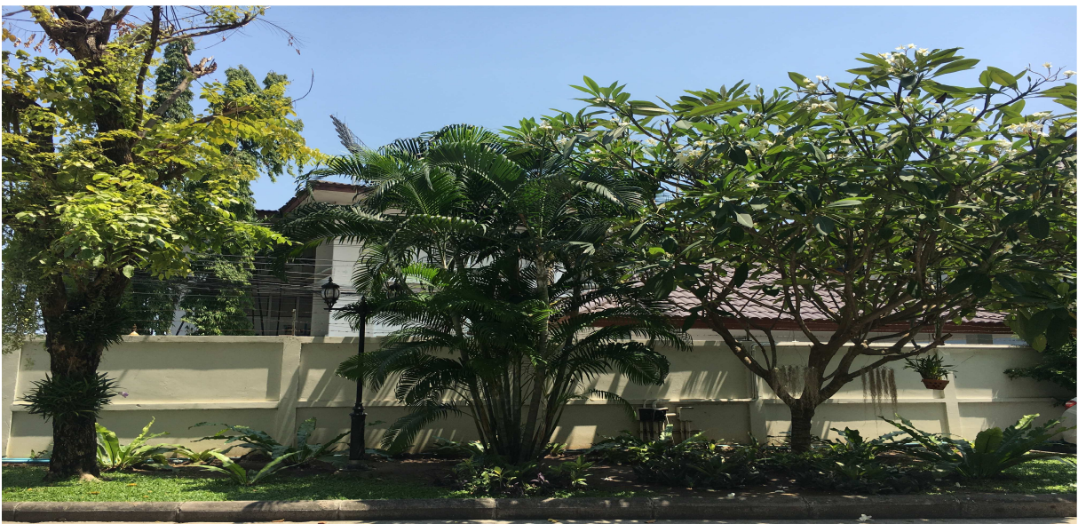
ภาพที่ 2-6 พื้นที่สีเขียวรอบพื้นที่โครงการฯ