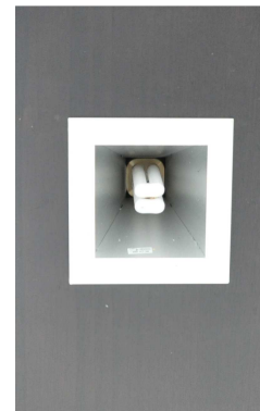
ภาพที่ 2-3 อุปกรณ์ประหยัดไฟฟ้าของโครงการฯ