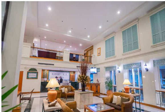
ภาพที่ 2-4 พนักงาน Reception ประจำโครงการฯ